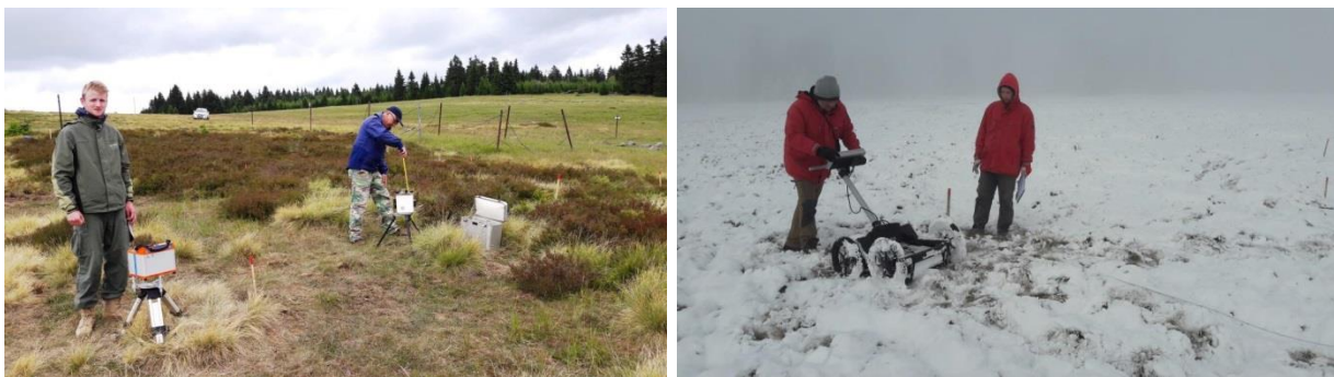
Obr. 1a,b. Měření dvěma gravimetry (vlevo) a georadarem